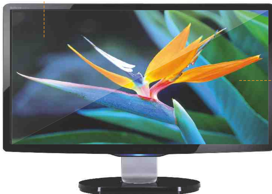
Image traitée en Multichromie